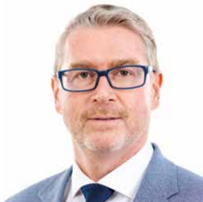
BÜRGERMEISTER GERNOT JETZ