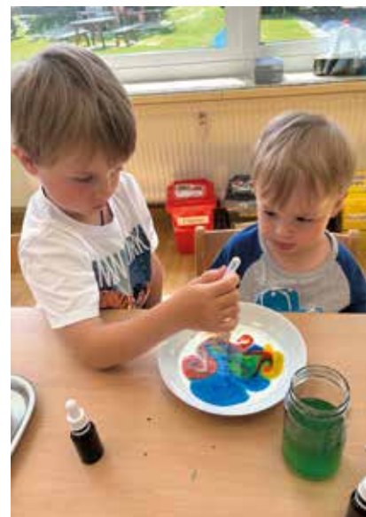
Viel Spaß beim Nachmachen.